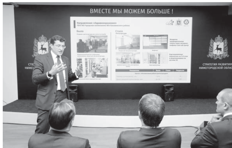
Губернатор презентовал первые результаты внедрения бережливых технологий в здравоохранении в рамках форума «Производительность 360» в начале июля.

Ну, и конечно, особое внимание региональные власти сегодня уделяют вопросу трудоустройства на селе. Региону нужны врачи, учителя, агрономы, зоотехники и другие